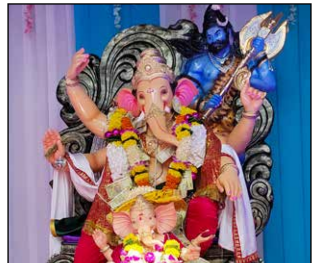
सूर्य यूथ फाउंडेशन सूर्य यूथ फाउंडेशन का यह पहला साल है जहां मुलुंड पश्चिम डंपिंग रोड पर बप्पा को विराजमान किया गया है। यहां ५ फुट की मूर्ति स्थापित की गई है।