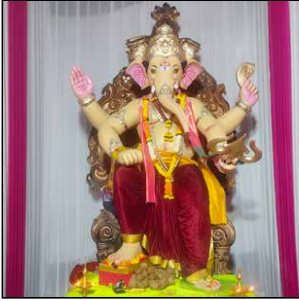
महाराष्ट्र मित्र मंडल मुलुंड पश्चिम वर्ष : २९वां वर्ष, उंची : १४ फीट