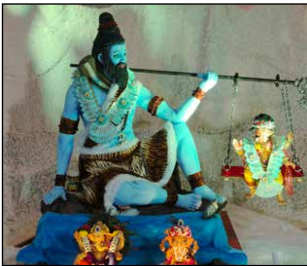
शिवाय मित्र मंडल मुलुंड पश्चिम देवी दयाल रोड पर मुलुंड चा शिवाय के नाम से मशहूर शिवाय मित्र मंडल की ओर से कैलाश पर्वत बनाकर भगवान शिव के त्रिशूल में बप्पा झूलते नजर आ रहे हैं। इस मंडल का यह पहला साल है।