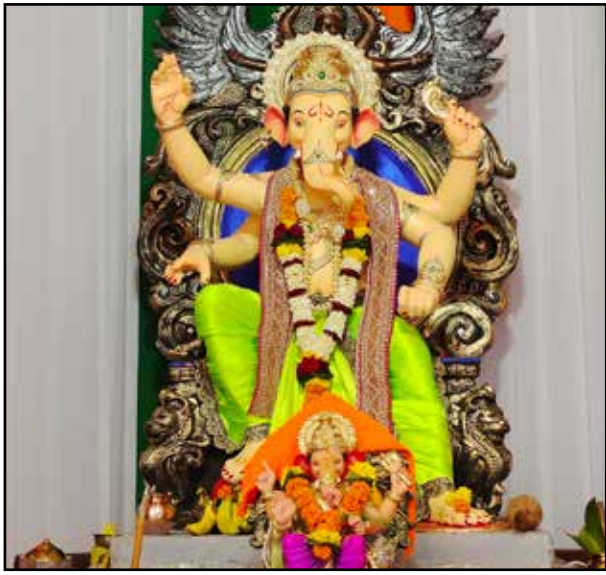
अचानक मित्र मंडल मंडल ओर से साढ़े ५ फुट की बप्पा की मूर्ति स्थापित की गई है। यह उनका तीसरा साल है।