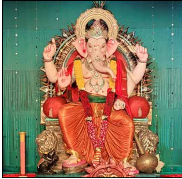
ध्रुव मित्र मंडल मुलुंड विश्वकर्मा नगर, वर्ष : ५०वां वर्ष उंची : ७ फीट