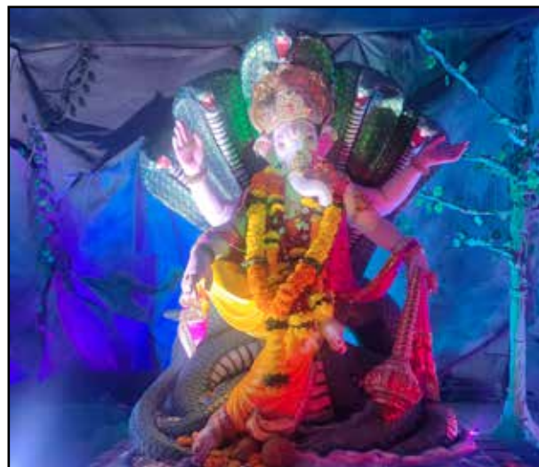
श्री हनुमान सेवा मंडल मुलुंड विजयनगर परिसर वर्ष : १६वां वर्ष, उंची : ६ फीट प्रमुखता : पूरी सजावट इको फ्रेंडली तरीके से की गई है।