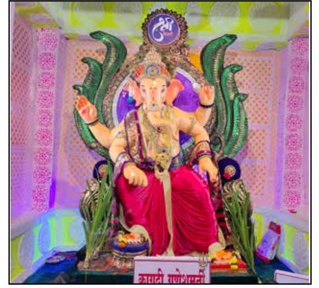
श्री केसरी मित्र मंडल मुलुंड पूर्व उंची : १० फीट प्रमुखता : पहला ऐसा मंडल है जो पेपर की बप्पा की मूर्ति स्थापित करते आ रहे है।