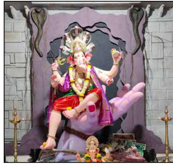
आदर्श तरुण मित्र मंडल सिद्धार्थ नगर, उंची : ८ फीट। भगवान शिव के हाथों में विराजमान हुए बप्पा श्रद्धालुओं के लिए आकर्षण का केंद्र बनता जा रहा है।