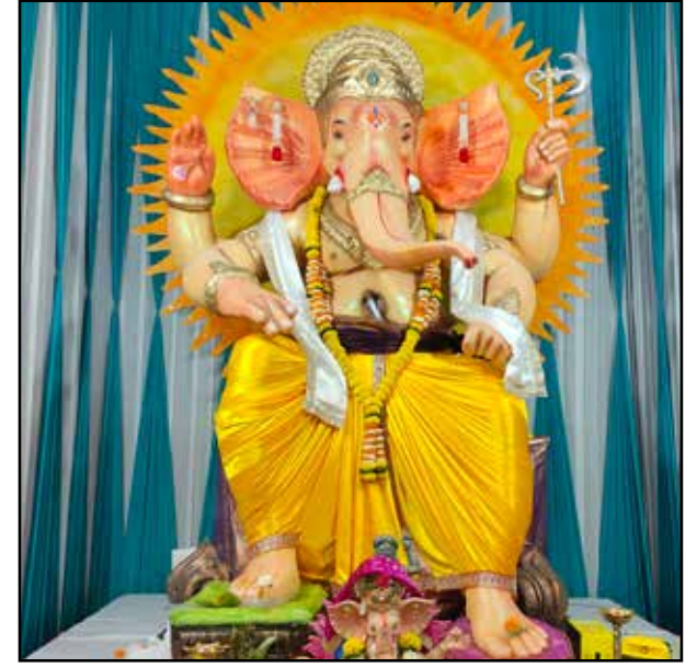
साईनाथ मित्र मंडल साई नाथ नगर वर्ष : १६वां वर्ष, उंची : १६ फीट