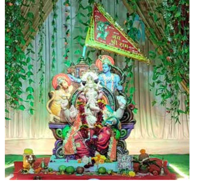
नवयुवक मंडल कोठारी निवास, मुलुंड वर्ष : ४०