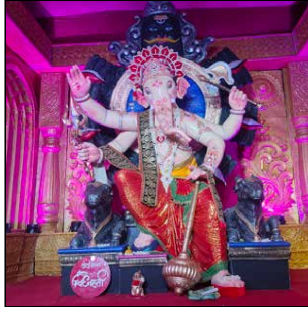
मुलुंड चा विघ्नहर्ता वर्ष : ५३वां वर्ष, उंची : १८ फीट पहली बार १९७० में सार्वजनिक गणेश उत्सव मनाया गया था।