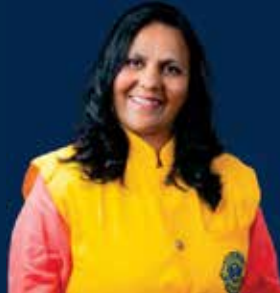
LL Aarjuli Chheda Club Secretary