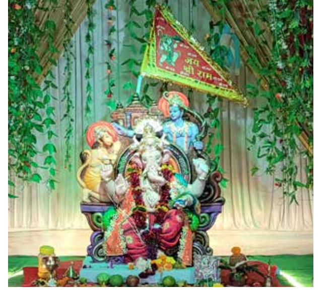
नवयुवक मित्र मंडळ कोठारी निवास, मुलुंड पश्चिम, यंदाचे ४० वे वर्ष.