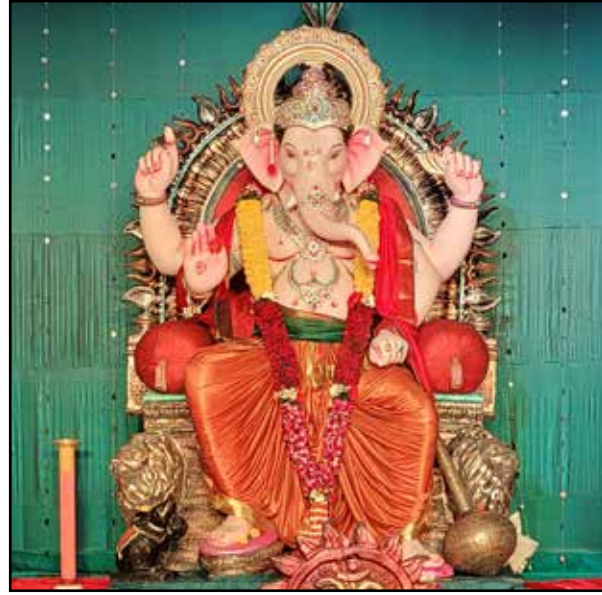
ध्रुव मित्र मंडळ विश्वकर्मा नगर, मुलुंड पश्चिम, उंची ७ फूट