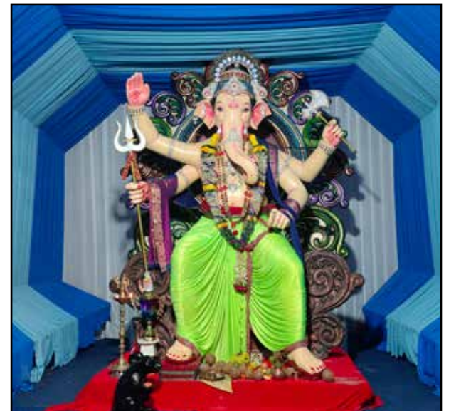
आझाद मित्र मंडळ रामगाव, मुलुंड पश्चिम, यंदाचे ४६ वे वर्ष