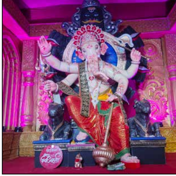
मुलुंडचा विघ्नहर्ता मुलुंड कॉलनी, यंदाचे ५३ वे वर्ष, उंची १८ फूट