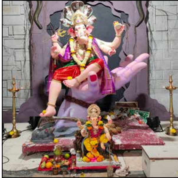
आदर्श तरुण मित्र मंडळ सिद्धार्थ नगर, वर्ष ५३ वे, उंची ८ फूट