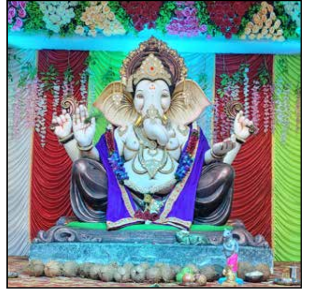
नीलम नगर गणेश उत्सव मंडळ नीलम नगर, मुलुंड पूर्व, उंची ५.५ फूट