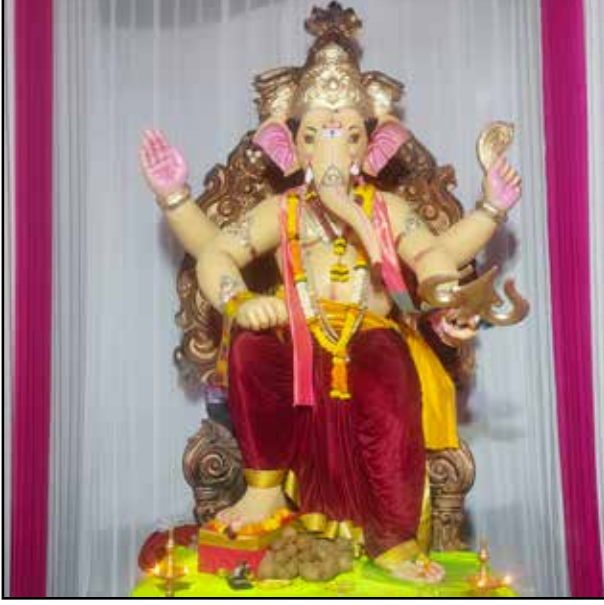
महाराष्ट्र मित्र मंडळ डंपिंग रोड, मुलुंड पश्चिम, यंदाचे २९ वे वर्ष, उंची १४ फूट