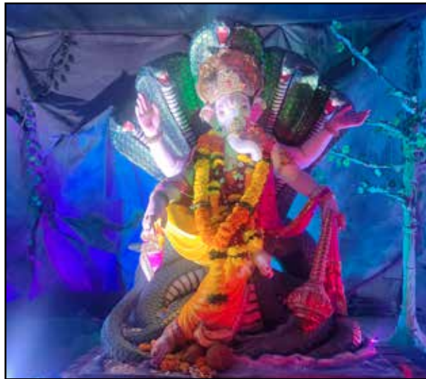
श्री हनुमान सेवा मंडळ विजय नगर, मुलुंड पश्चिम, यंदाचे १६ वे वर्ष, शेषनागावर ६.५ फूट उंच गणेशमूर्तीची प्रतिष्ठापना केली आहे. सजावट पर्यावरणपूरक पद्धतीने केली आहे.