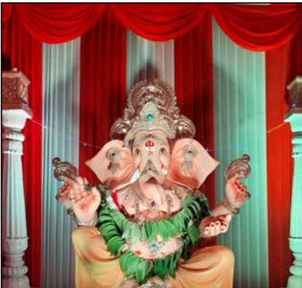
सार्वजनिक उत्सव समिती मंडळ जे. एन. रोड, मुलुंड पश्चिम, यंदाचे ४० वर्ष, उंची ६.५ फूट