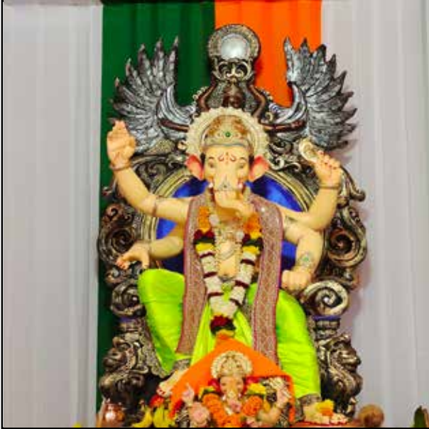
अचानक मित्र मंडळ डंपिंग रोड, मुलुंड पश्चिम, वर्ष ३ रे, उंची ५.५ फूट