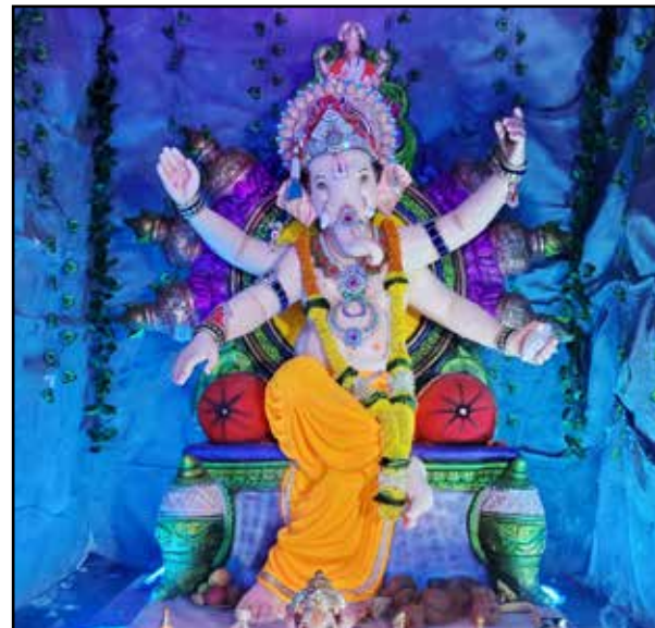
श्री गिरीजा मित्र मंडळ नाहूर गाव, यंदाचे १५ वे वर्ष, उंची ८ फूट