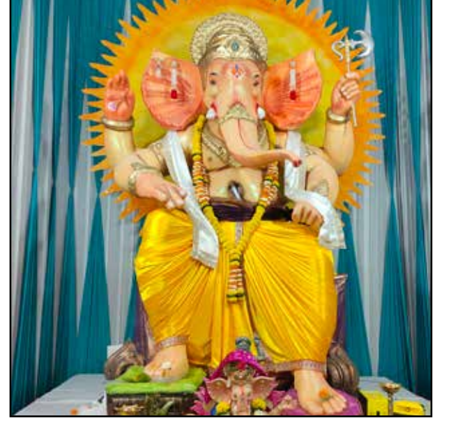
साईनाथ मित्र मंडळ साईनाथ नगर, मुलुंड पूर्व, यंदाचे १६ वे वर्ष, उंची १६ फूट