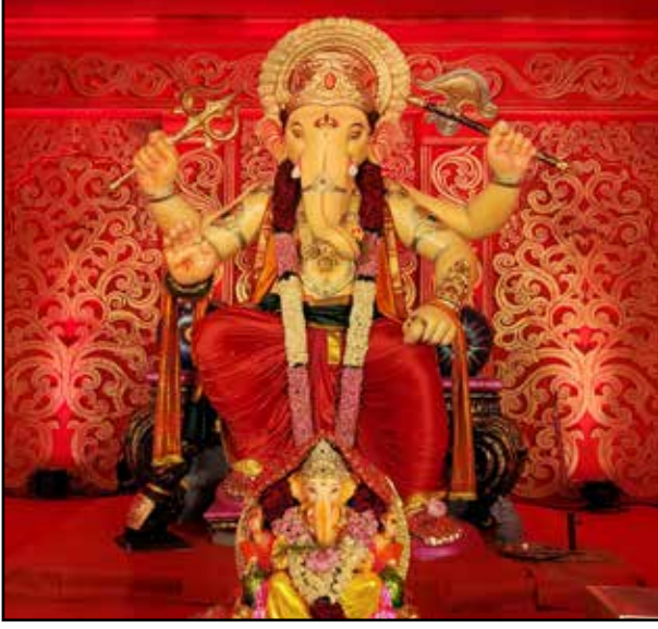
श्री गणेश मित्र मंडळ पटाई बाप्पा चंदन बाग लेन, यंदाचे ५९ वे वर्ष, उंची १३ फूट, लाल महाल मधील एका दालनाचा देखावा.