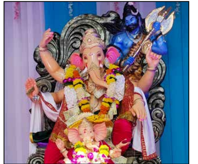
सूर्या युथ फाऊंडेशन डंपिंग रोड, मुलुंड पश्चिम, यंदाचे पहिले वर्ष, उंची ५ फूट. गणेशभक्तांसाठी मोफत डोळ्यांची तपासणी शिबीराचे आयोजन.