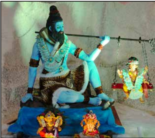
शिवाय मित्र मंडळ देवी दयाल रोड, मुलुंड पश्चिम, यंदाचे पहिले वर्ष, कैलास पर्वत साकारल्यानंतर बाप्पा भगवान शिवाच्या त्रिशूळावर डोलताना दिसतात.