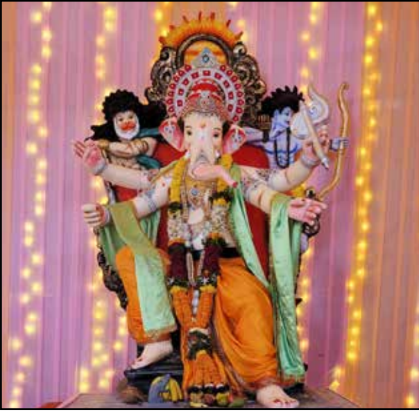
श्री बाल गोपाळ मित्र मंडळ ९० फीट रोड, मुलुंड पूर्व, यंदाचे २३ वे वर्ष