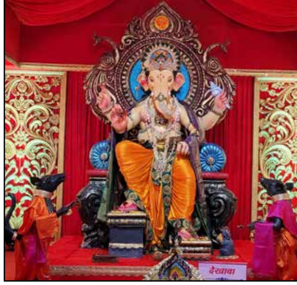
सरगाम मित्र मंडळ आर.एच.बी. रोड, यंदाचे ५१ वे वर्ष, उंची १० फूट