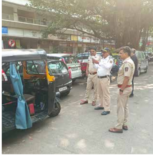
१५ नवंबर तक १८ हजार ५४८ वाहनों पर मोटर वाहन एक्ट १२२ के तहत कार्रवाई की गई है। आपको बता दें मोटर

मुंबई में आए दिन वाहनों की संख्या बढ़ती जा रही है और इन्हीं बढ़ती वाहनों की संख्या को देखते हुए कई बार नागरिकों को ट्रैफिक जाम का सामना करना पड़ता है। इनमें से अधिकतर समय अवैध पार्किंग और डबल पार्किंग जैसे कई कारणों के चलते यह ट्रैफिक जाम देखा जाता है। मुलुंड में भी कई बार इस तरीके की समस्याओं का सामना नागरिकों को करना पड़ा है। जिसको देखते हुए अब मुलुंड यातायात विभाग अलर्ट मोड पर आ गई से और कार्रवाई को तेज कर दिया गया है। आंकड़ों की माने तो एक जनवरी से लेकर