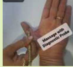
(चित्र १ प्रमाणे)